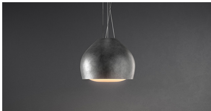
Снимката е само за информация Може да не отговаря на избрания модел